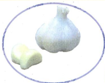
【良質小粒 にんにく】