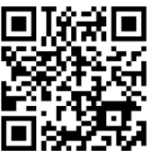
補充予約利用者登録画面 QRコード

※サインレスチェックインを利用するためには同伴者登録のお名前が補充予約登録内容と一致していることが条件となります。 ※ゴルフ場利用税免税対象の方(年齢18歳未満の方又は70歳以上の方、障害者手帳をお持ちの方等)は、別途フロントまで適用申請手続きを必ず行ってください。