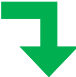
自動精算機にて チェックイン