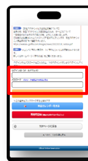
オンライン予約ログイン