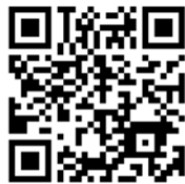
オンライン予約利用者登録 QRコード