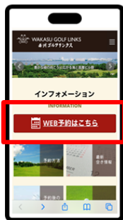
ホームページ "WEB予約はこちら"タップ