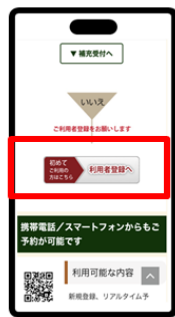
利用者登録へをタップ