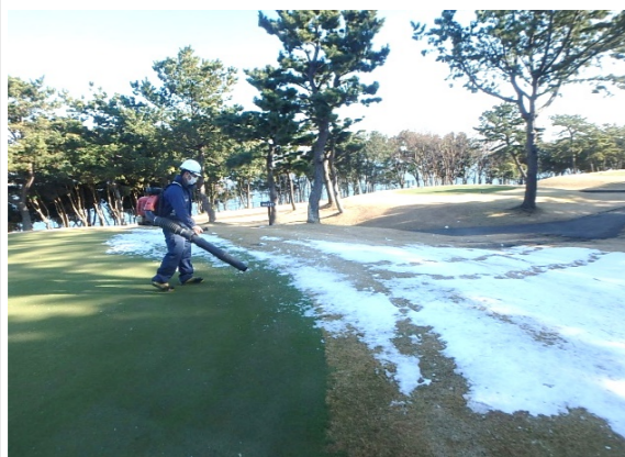
・ 1/6積雪のため除雪作業