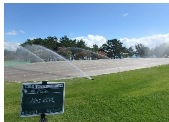
グリーン種まき・芝生養生