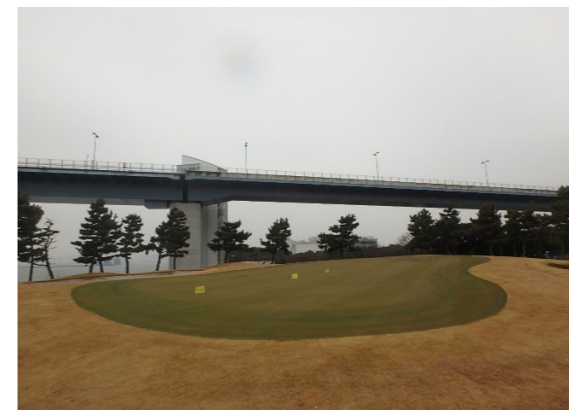
・ Hole5全景及び接写 グリーン播種後、約20週間経過後の生育状況