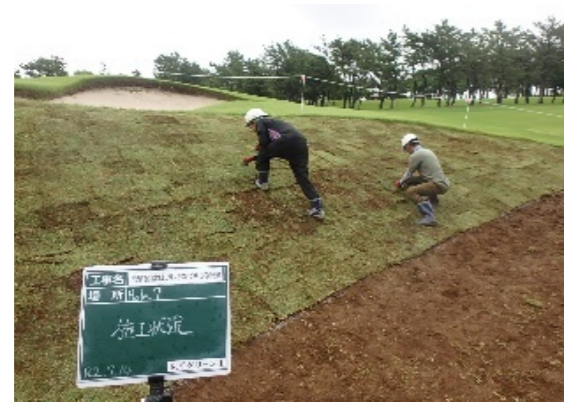
グリーン周り芝張り