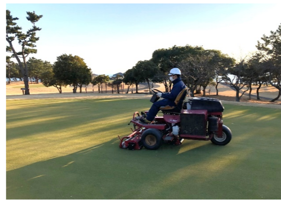
・ 芝生養生管理 グリーン転圧