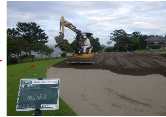
グリーン砂敷き均し