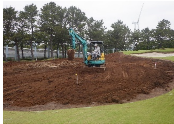
既存グリーン撤去・造形