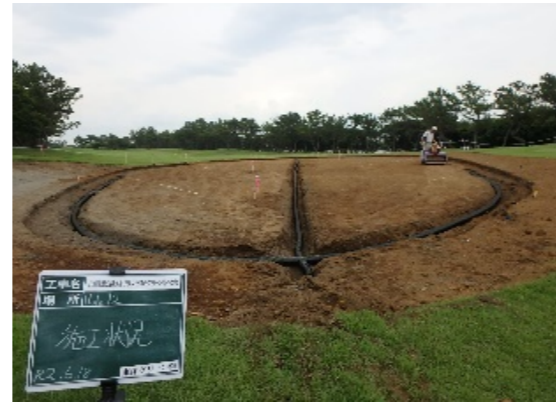
グリーンの暗渠敷設