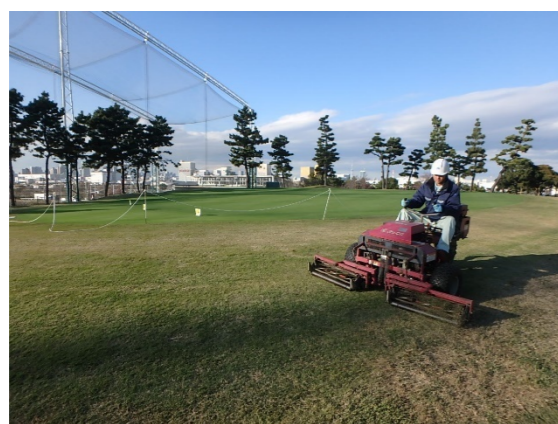
芝生養生管理 刈込・施肥薬・散水・目砂散布・ローラー転圧