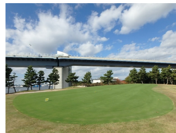
Hole5全景及び接写 グリーン播種後、約12週間経過後の生育状況