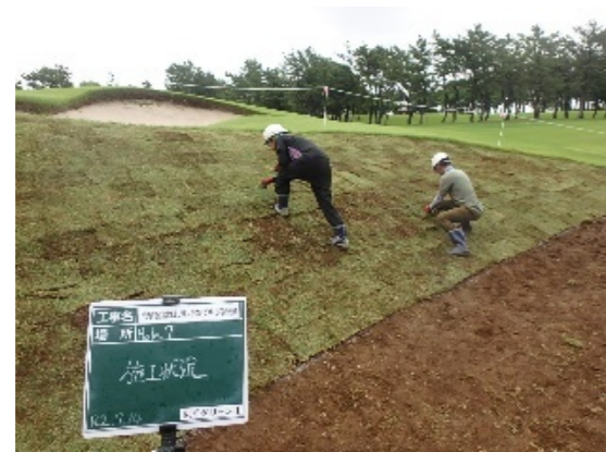
グリーン周り芝張り