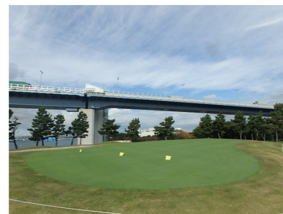
Hole 5 全景及び接写 グリーン播種後、約7週間経過後の生育状況