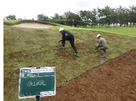
グリーン周り芝張り