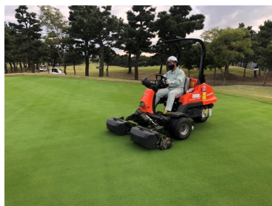
芝生養生管理 刈込・施肥薬・散水・目砂散布・ローラー転圧