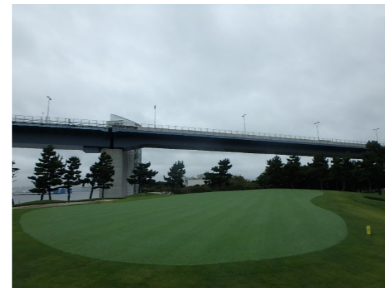
Hole 5 全景及び接写 グリーン播種後、約7週間経過後の生育状況