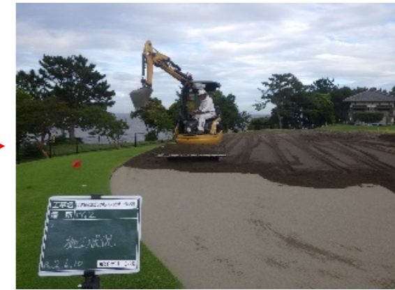
グリーン砂敷き均し