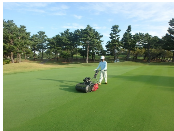
芝生養生管理 刈込・施肥薬・散水・目砂散布