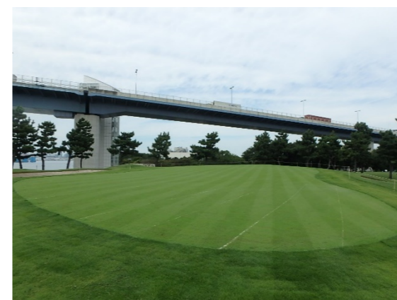
Hole 5 全景及び接写 グリーン播種後、約3週間経過後の生育状況