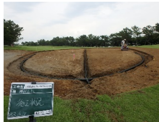
グリーンの暗渠敷設