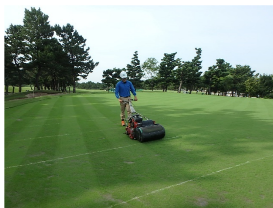
芝生養生管理 刈込・施肥薬・散水