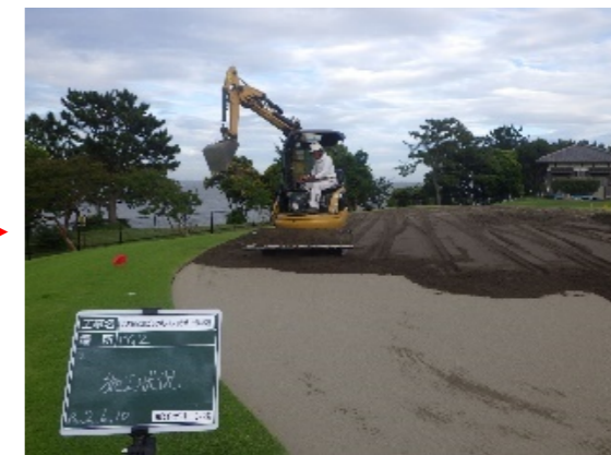
グリーン砂敷き均し