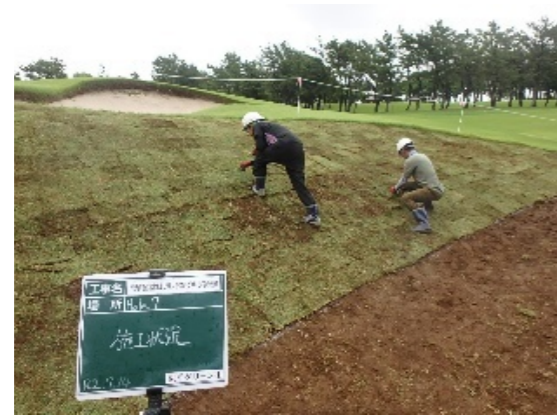
グリーン周り芝張り